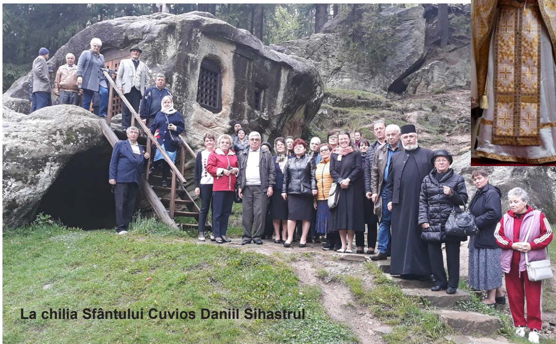
La chilia Sfântului Cuvios Daniil Sihastrul

mănăstirile: Râșca, Humor, Voroneț, Moldovița, Sucevița, Putna, Cămârzani și Roman (la Catedrala Arhiepiscopală). Închinarea la mormântului Sfântului