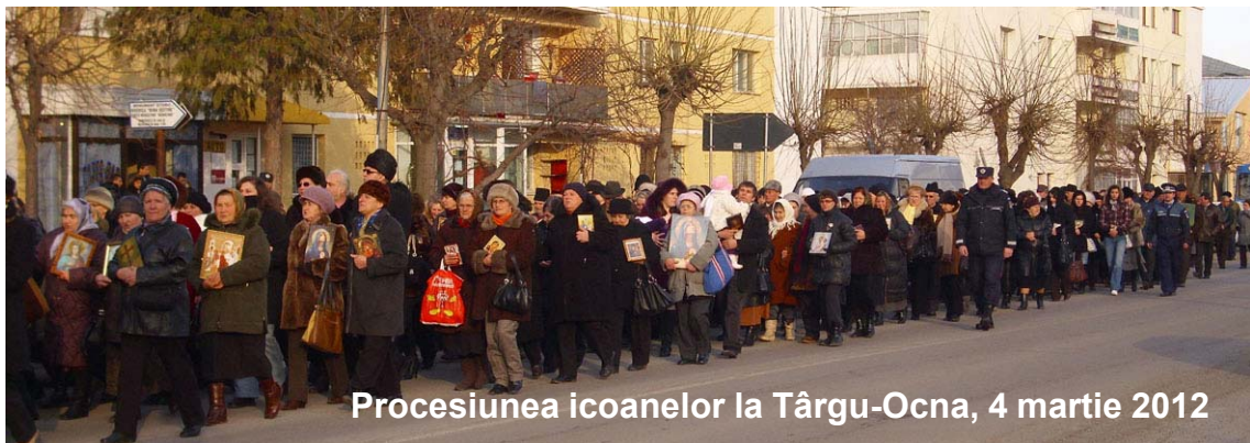
Procesiunea icoanelor la Târgu-Ocna, 4 martie 2012

În după amiaza Duminicii Ortodoxiei, 4 martie 2012, preoții din Târgu-Ocna și din împrejurimi împreună cu enoriașii parohiilor lor au organizat un pelerinaj în oraș purtând în procesiune icoane sfinte spre slava Preasfintei Treimi și întru preamărirea Întrupării lui Hristos. De altfel, Întruparea Domnului stă la temelia prezenței icoanelor în Biserică, așa precum firea omenească a Domnului luată din