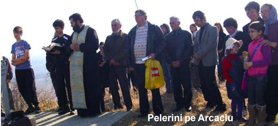
Pelerini pe Arcaciu

Pelerinaj la Crucea de pe Arcaciu, în Duminica Sfintei Cruci