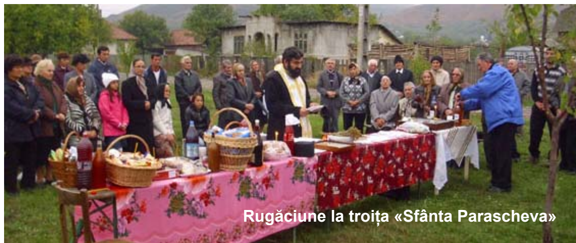
Rugăciune la troița «Sfânta Parascheva»

una învățătura despre cinstirea icoanelor în Biserica noastră Ortodoxă.