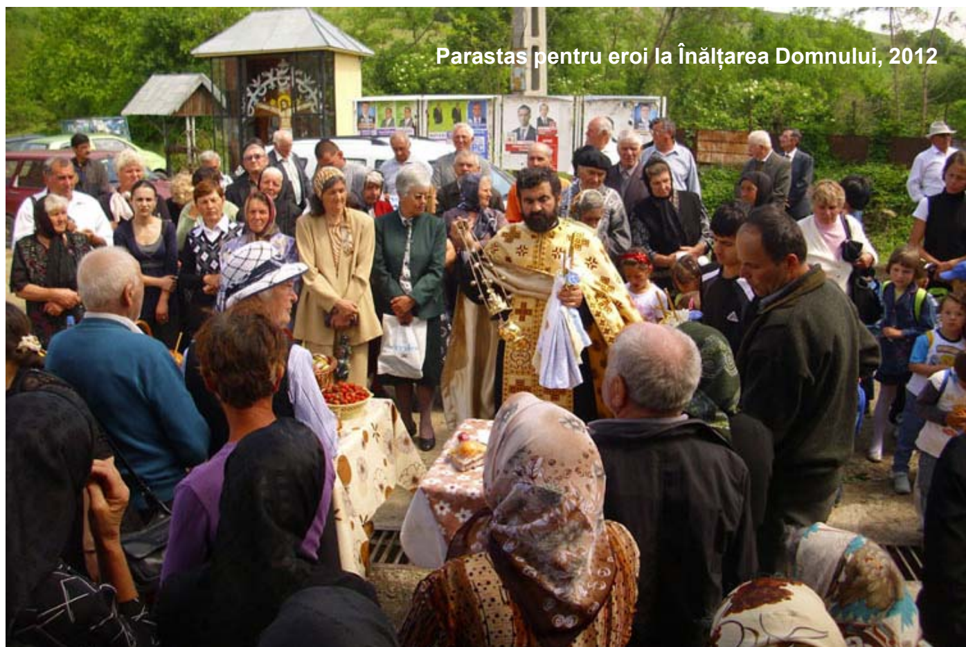
Parastas pentru eroi la Înălțarea Domnului, 2012