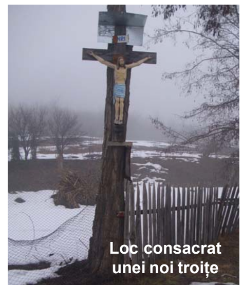
Loc consacrat unei noi troițe

Fie ca sfinții îngeri să ocrotească lumea întregă de primejdii și necazuri. Celor ce poartă numele celor doi Arhangheli le dorim sănătate și să trăiască întru mulți și frumoși ani!