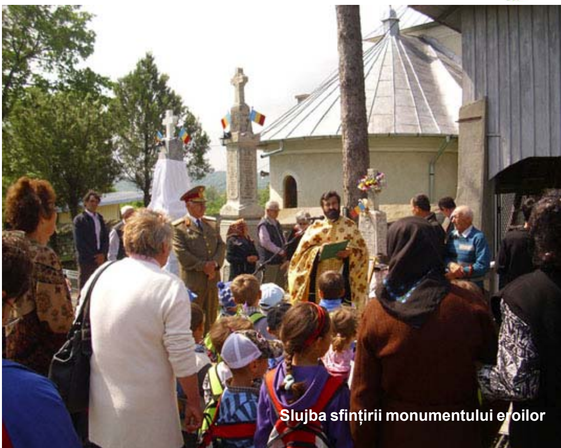
Slujba sfințirii monumentului eroilor

Dumnezeu să-i odihnească în pace pe eroii neamului nostru românesc între care cei din Viișoara ne vor ține neconținut legați de pământul străbun.