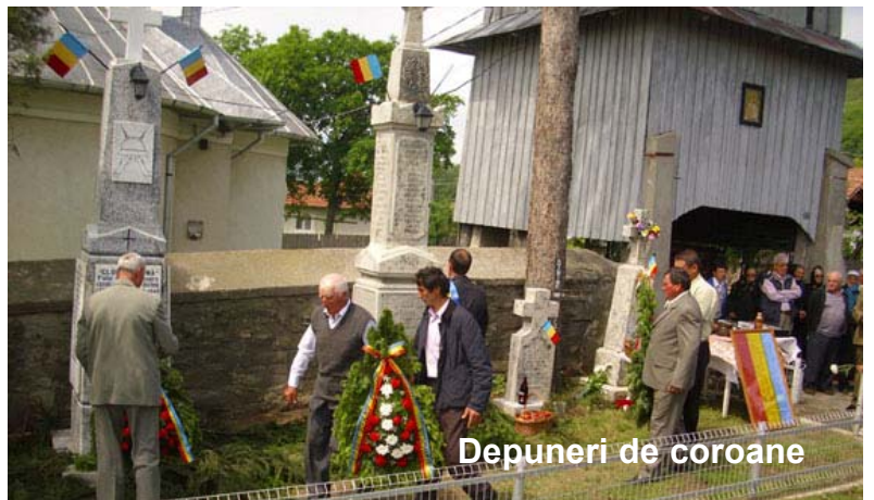
Depuneri de coroane