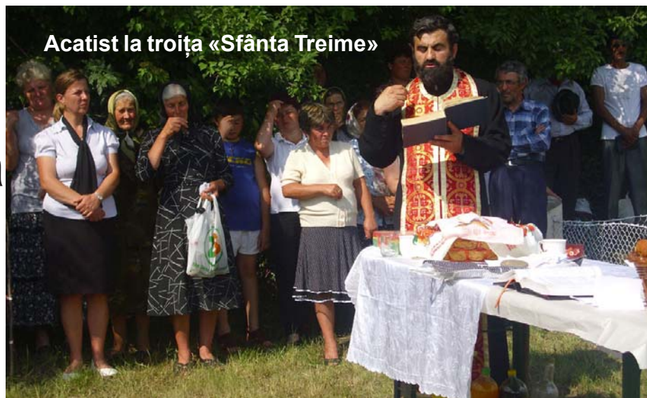
Acatist la troița «Sfânta Treime»

Fie ca această dintâi sărbătoare la această troiță a Parohiei să fie un frumos început pentru celelalte ce vor urma în cursul anului la Viișoara.