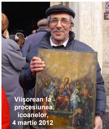
Vișorean la procesiunea icoanelor, 4 martie 2012

Sfânta Fecioară Maria a fost copleșită de cea dumnezeiască, fără să se amestece una cu cealaltă, întocmai suportul și culoarea icoanei și-au căpătat sfințenie prin Cel Nevăzut reprezentat în ea.