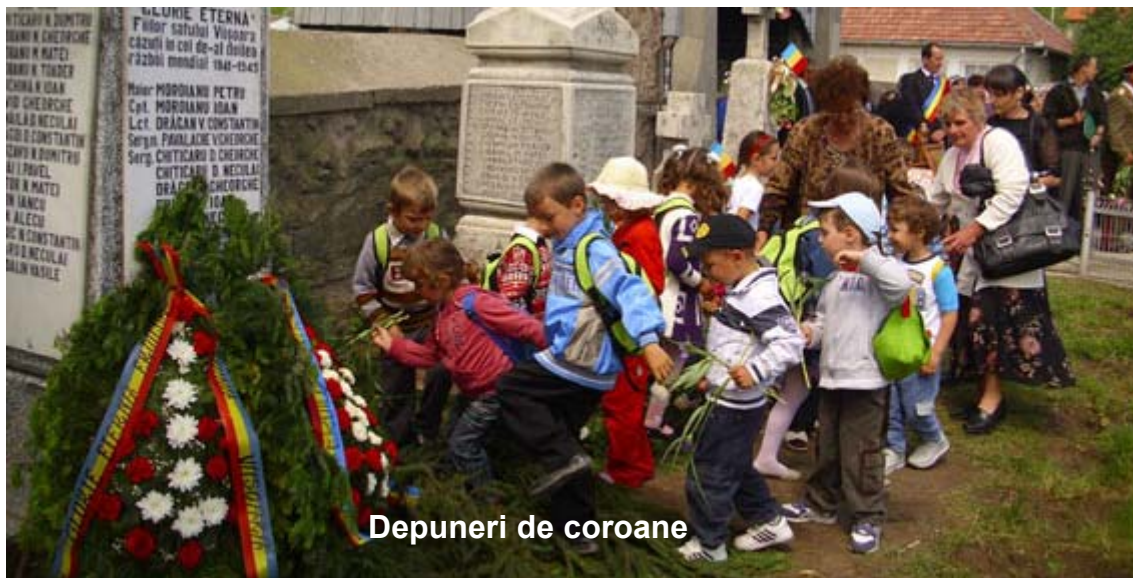
Depuneri de coroane