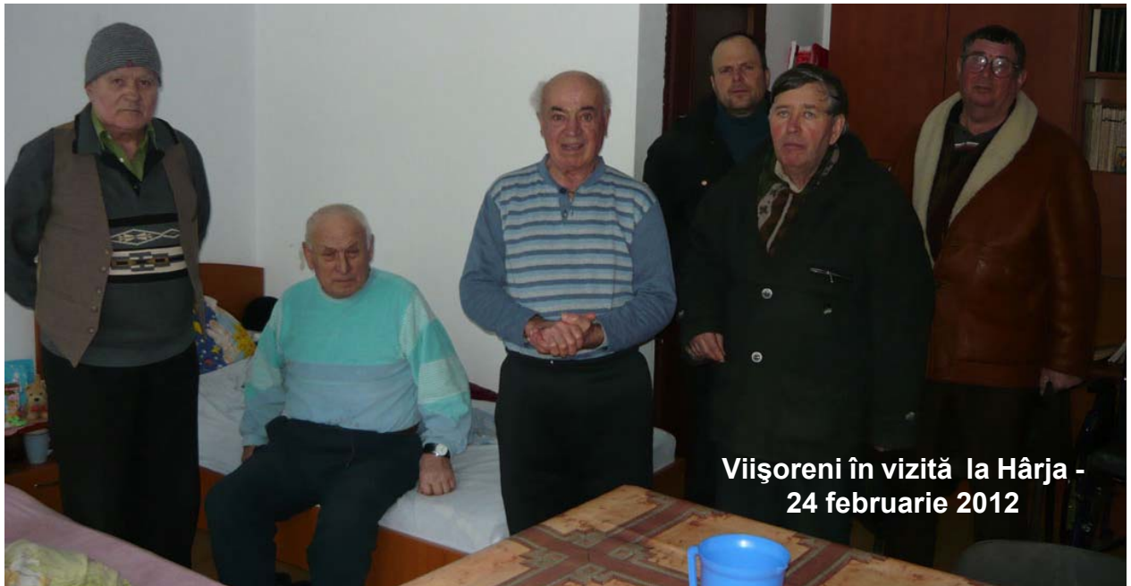
Viișoreni în vizită la Hârja - 24 februarie 2012

«Bolnav am fost și ați venit la Mine» la Hârja