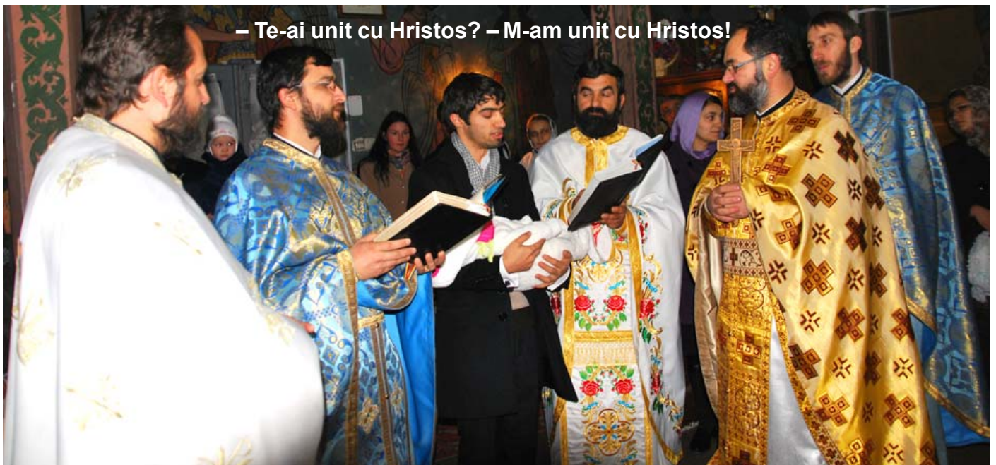
– Te-ai unit cu Hristos? – M-am unit cu Hristos!

Aceasta ne face să înțelegem că tămăduirea păcatelor cerută atât de insistent în rugăciunile tainei se referă, de fapt, la rădăcinile păcatelor, care pe fondul slăbiciunii și obișnuinței cu păcatul pot genera mereu alte păcate, iar prin aceasta să aibă ca efect văzut boala trupului.