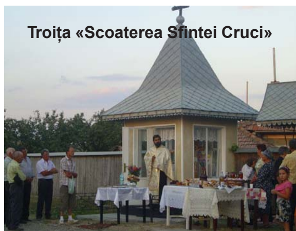
Troița «Scoaterea Sfintei Cruci»

prooroc Ilie să privească plini de îndurare spre noi și să ne miluiască. Amin.