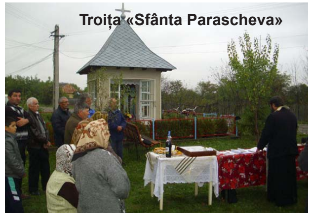
Troița «Sfânta Parascheva»

Cuvântul de învățătură ne-a purtat prin viața neprihănită a fecioarei Parascheva care, la o vârstă destul de mică, a ascultat cu atenție Cuvântul lui Dumnezeu din biserică și a ales să devină mireasă a lui Hristos. Sfințirea icoanei Maicii Domnului ne-a adus aminte și de Sfinții Părinți de la Sinodul al VII-lea Ecumenic, pomeniți în această duminică, a 21-a după Rusalii, care au statornicit odată pentru totdea-