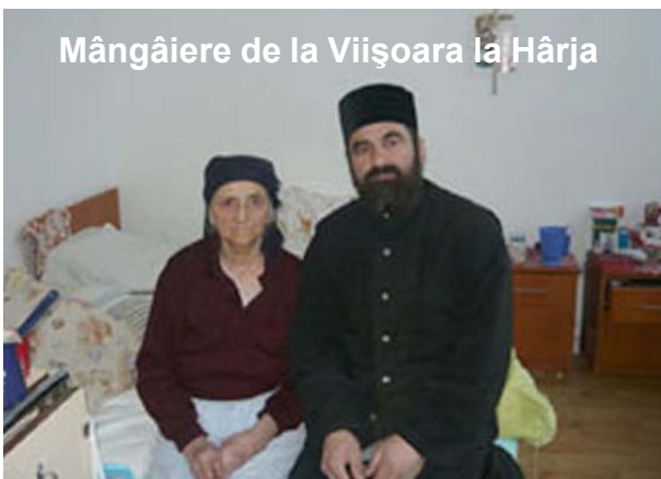
Mângâiere de la Viișoara la Hârja