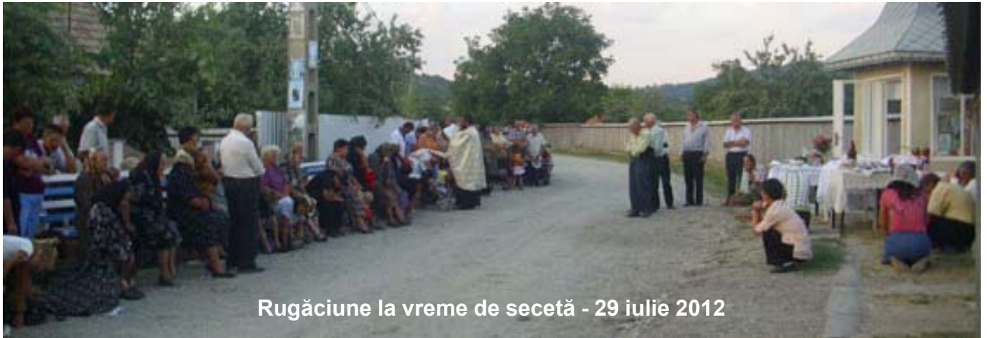
Rugăciune la vreme de secetă - 29 iulie 2012