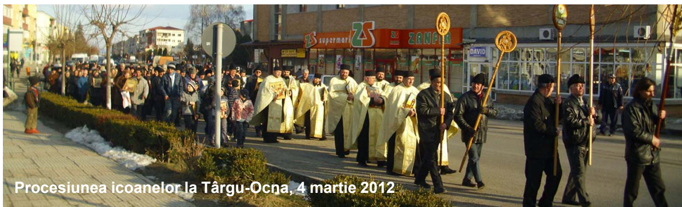
Procesiunea icoanelor la Târgu-Ocna, 4 martie 2012