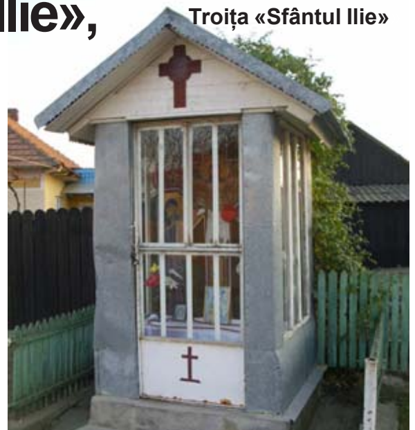
Troița «Sfântul Ilie»

viișorenilor, am săvârșit sfințirea apei și slujba pentru vreme de neplouare, popasul duhovnicesc încheindu-se cu un cuvânt de învățătură din care am reținut că Dumnezeu așteaptă mai întâi un semn de la noi în ceea ce privește părerea de rău pentru păcatele noastre care au întărit mânia Sa asupra pământului, ca apoi să ne răspundă cu ploaie binecuvântată. Ne rugăm lui Dumnezeu și Sfântului