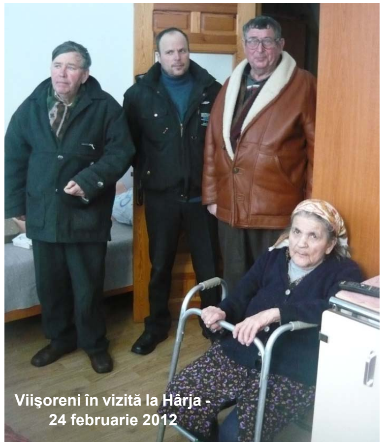
Viișoreni în vizită la Hârja - 24 februarie 2012

Fie ca ofranda dragostei viișorenilor să fie semn de primăvară și cale împărătească spre Postul Mare.