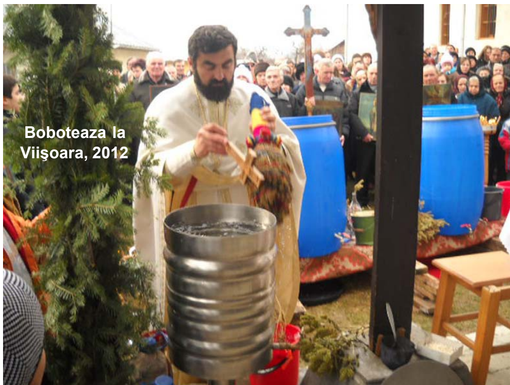
Boboteaza la Viișoara, 2012

Fie ca harul Botezului Domnului să ne fie tuturor de folos spre mântuire.