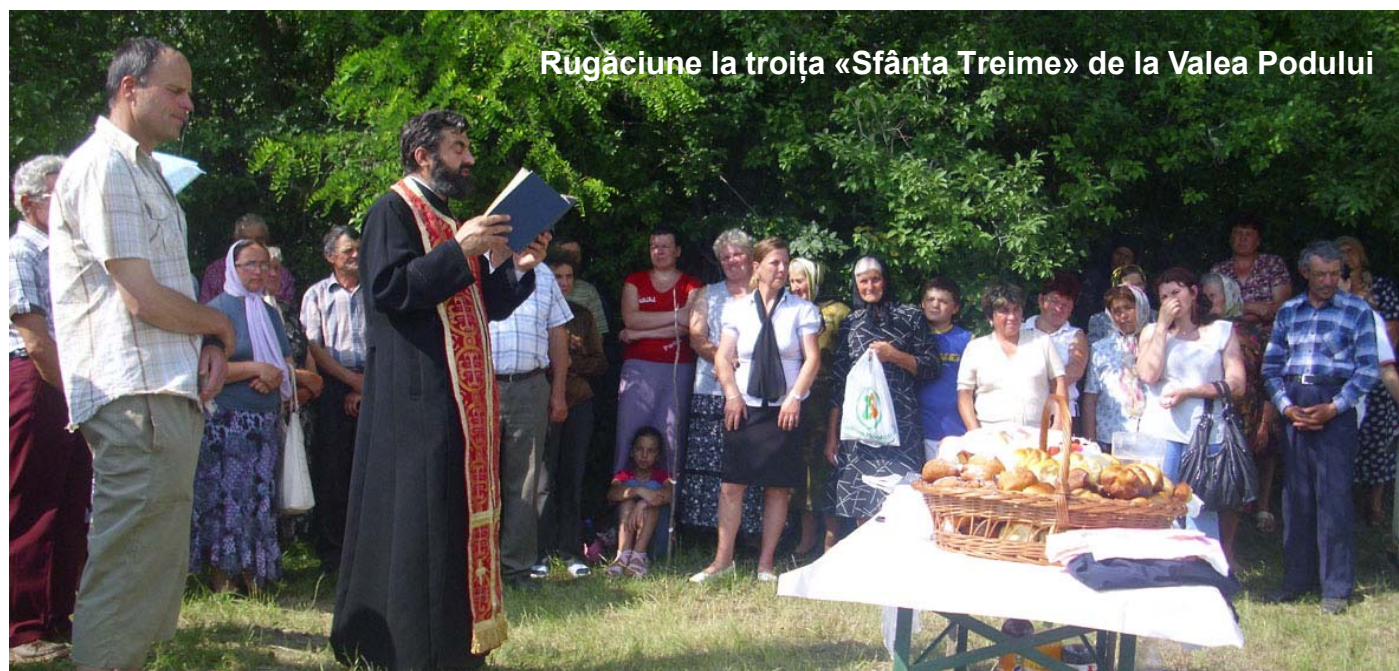
Rugăciune la troița «Sfânta Treime» de la Valea Podului