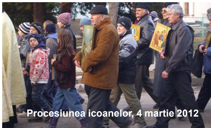
Procesiunea icoanelor, 4 martie 2012

Au participat credincioși din Vișoara, din Pârâu Boghii și Tisești, din Poeni, de la Doftena și de la parohiile din oraș, Răducanu, Sfinții Voievozi și Precista, mulțimea de credincioși cu mulțime de icoane intonând cântări de slavă Preasfintei Treimi pe tot parcursul procesiunii, încheierea săvârșindu-se în catedrala