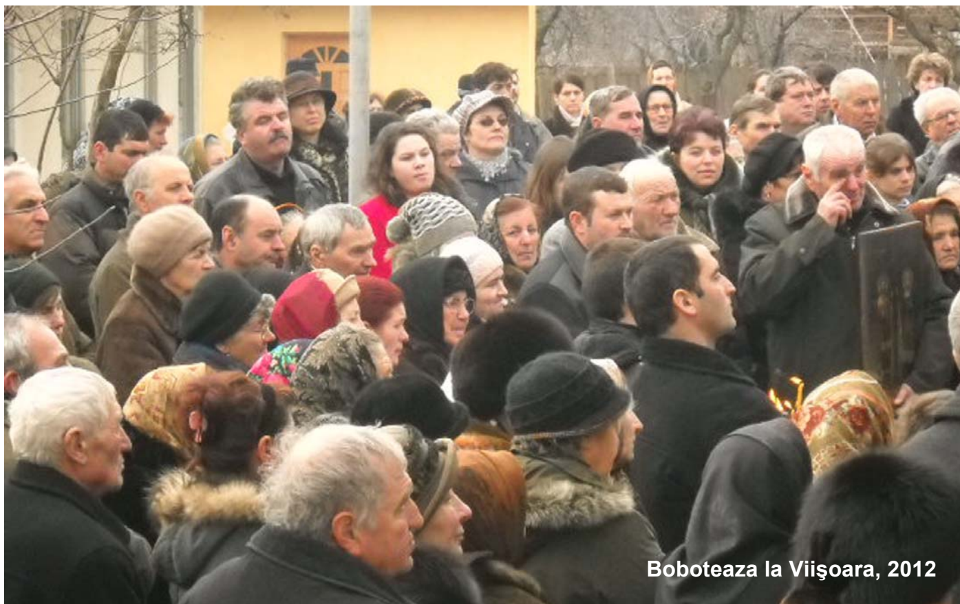
Boboteaza la Viișoara, 2012