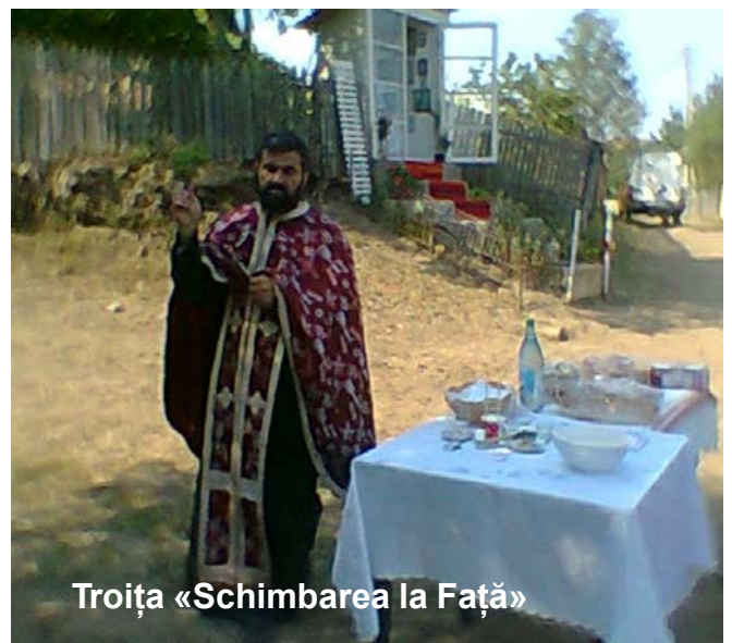
Troița «Schimbarea la Față»

Ne-am urcat la troița aceasta poate nu cu credința celor trei apostoli Petru, Iacob și Ioan! Și nici cu a celorlalți rămași la poalele muntelui. Și de aceea poate n-am fost vrednici să vedem nimic din slava lui Hristos, ci doar urme ale strălucirii Sale. Dar toți ne simțim datori cu o rugăciune de iertare a păcatelor și de mărire a credinței pentru ca cererile noastre să fie bine primite de Dumnezeu.